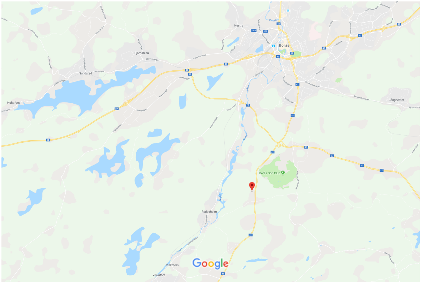
1 km