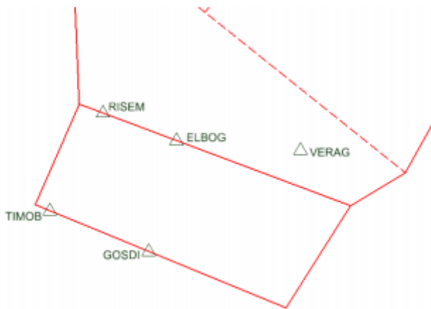
Karta nya 5LNC, Timob och Gosdi